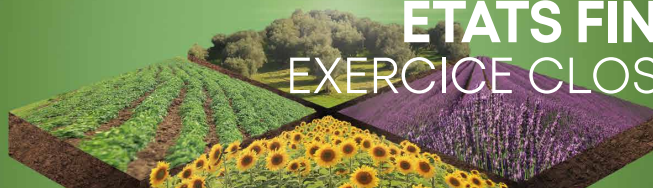
TABLEAU DES TITRES DE PARTICIPATION